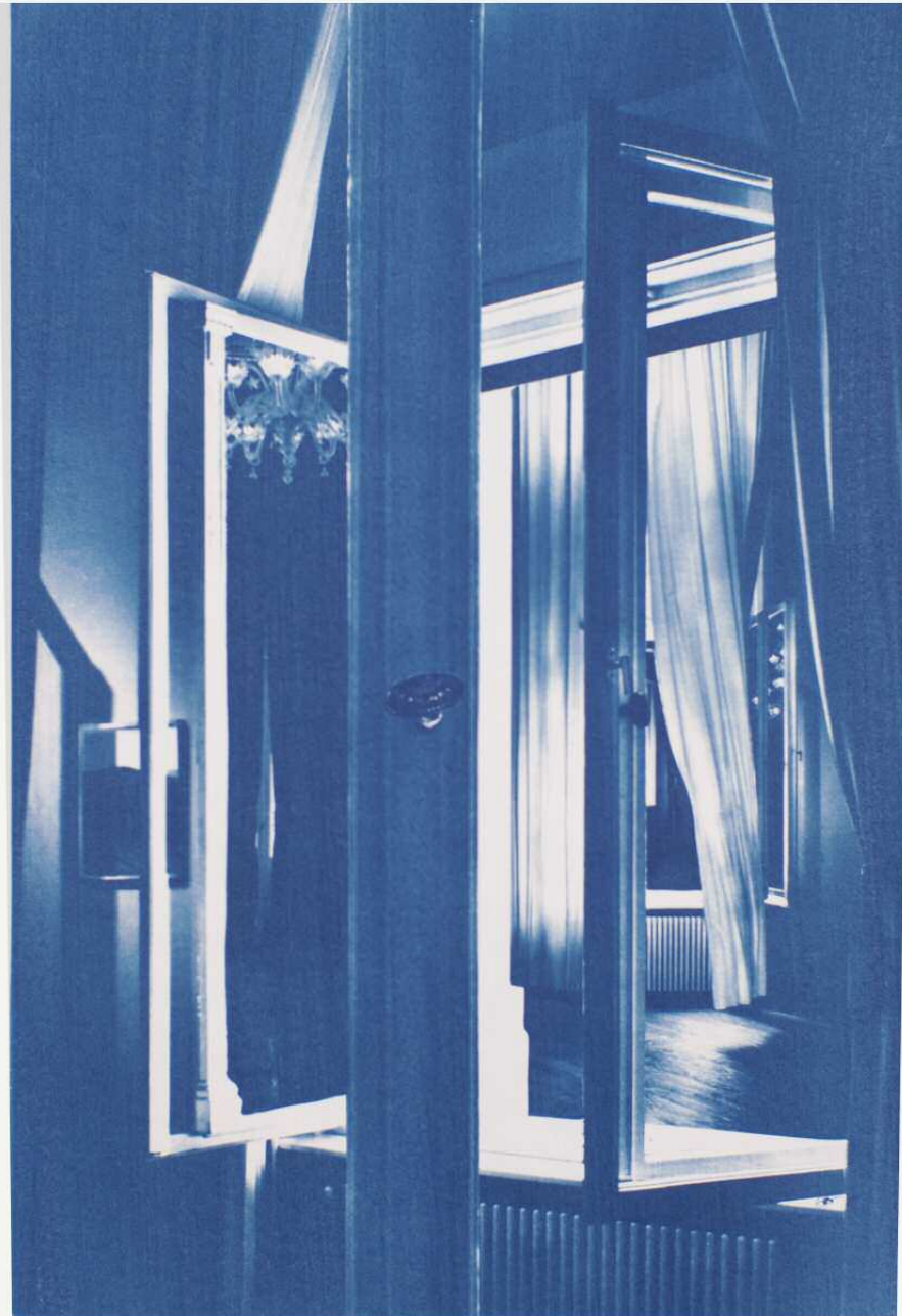
Pentimenti (Löwenpalais) #3 Fotocollage, Cyanotypie auf Büttenpapier, 70 x 50 cm, 2012