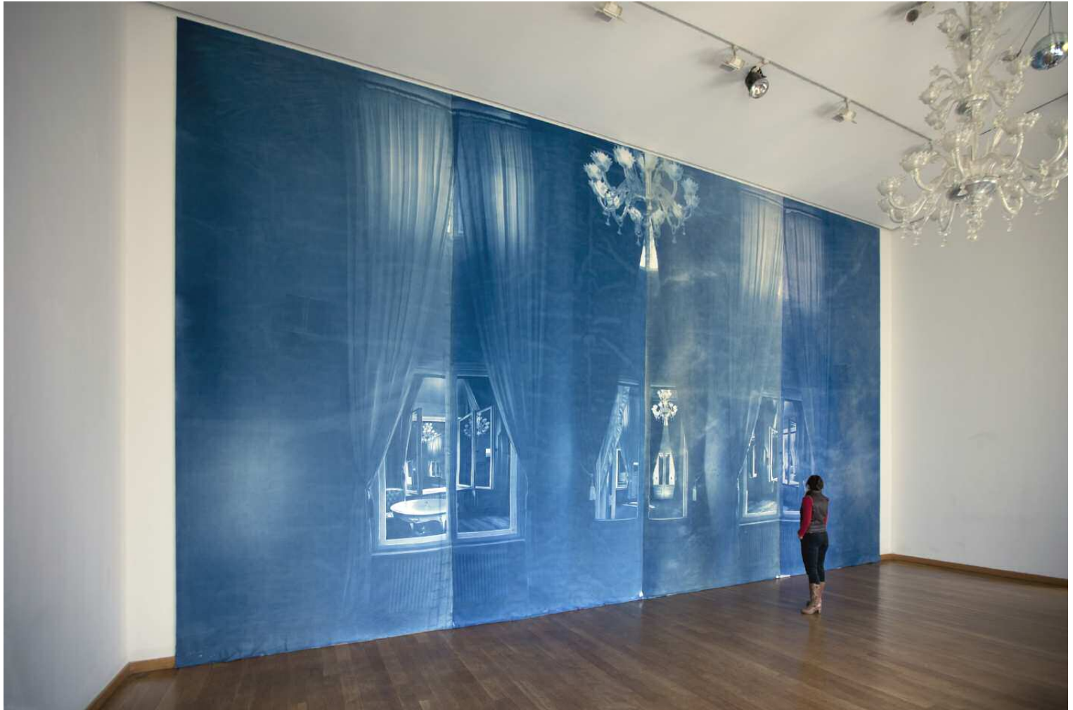
Pentimenti (Löwenpalais) #1 Fotocollage, Cyanotypie auf Stoff, 6,4 x 11,8 m Stiftung Starke, Löwenpalais, Berlin 2012