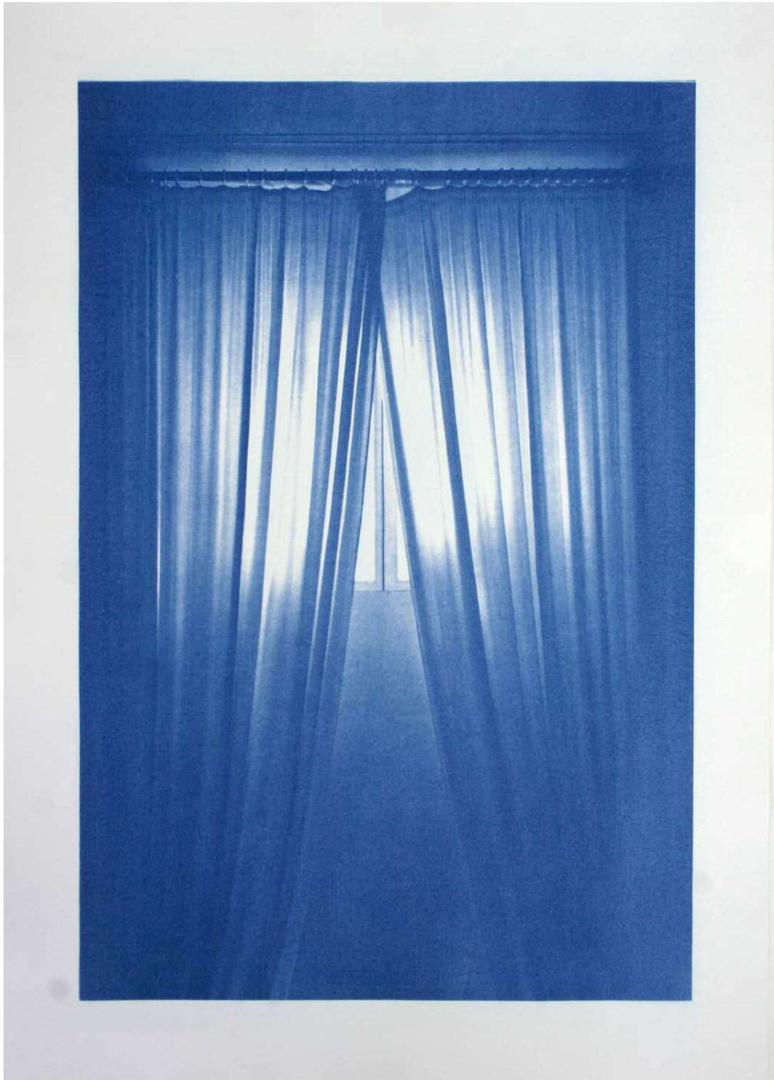
Pentimenti (Löwenpalais) #7 Fotocollage, Cyanotypie auf Büttenpapier, 70 x 50 cm, 2012