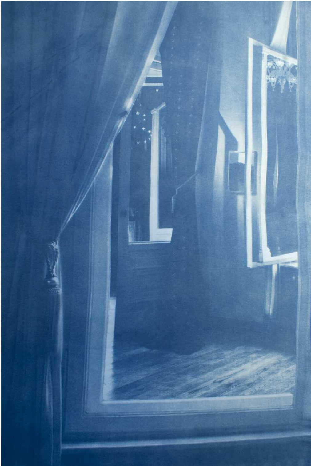
Pentimenti (Löwenpalais) #1 Fotocollage, Cyanotypie auf Stoff, 6,4 x 11,8 m Stiftung Starke, Löwenpalais, Berlin 2012