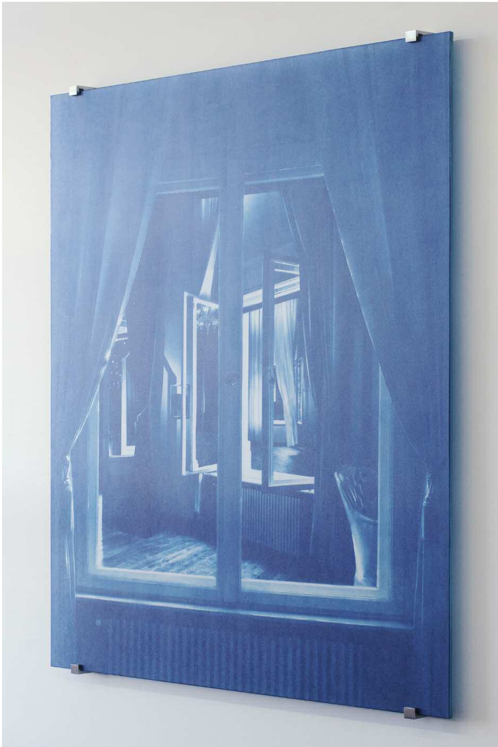
Pentimenti (Löwenpalais) #12 Fotocollage, Cyanotypie auf Fliespapier auf Glas, 121 x 88 cm, 2012