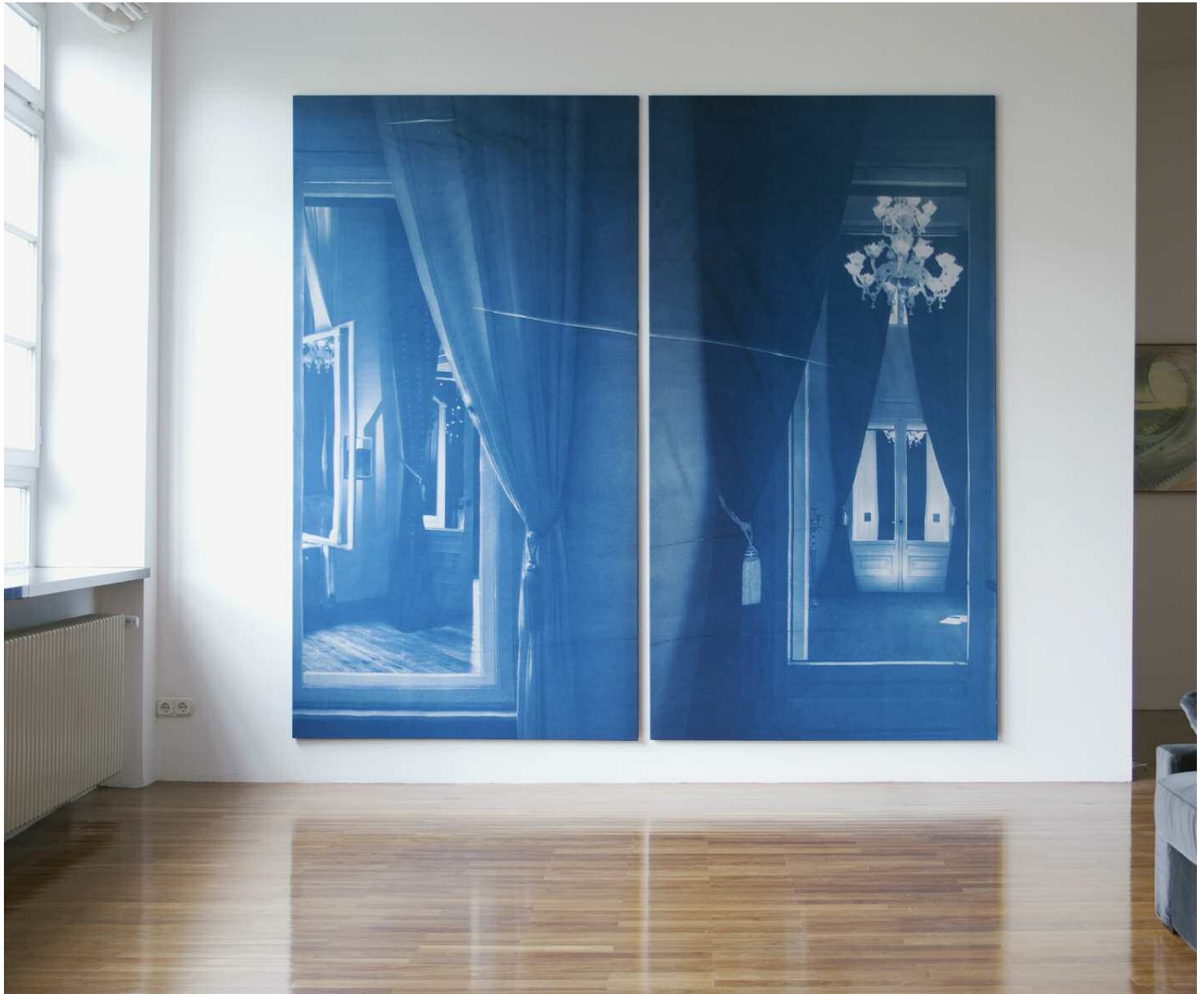
Pentimenti (Löwenpalais) #2 Fotocollage, Cyanotypie auf Stoff, 6,4 x 11,8 m Stiftung Starke, Löwenpalais, Berlin 2012