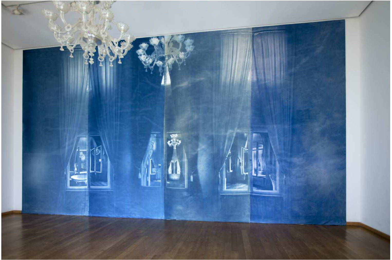
Pentimenti (Löwenpalais) #1 Fotocollage, Cyanotypie auf Stoff, 6,4 x 11,8 m Stiftung Starke, Löwenpalais, Berlin 2012